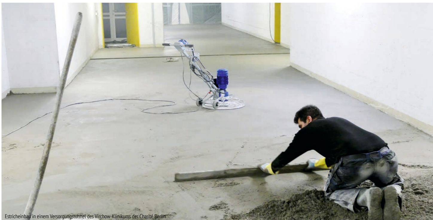
Estrichbau in einem Versorgungstunnel des Virchow-Klinikums der Charité Berlin

gen erzielt. Schließlich müssen im Idealfall statt 8 cm Estrich nur 5 cm aufgeheizt werden, was im Übrigen auch Material und damit Zeit sowie Geld spart.