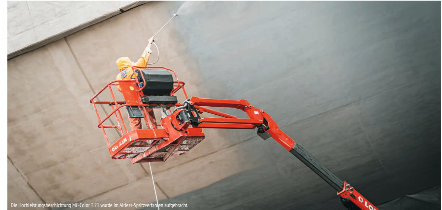
Die Hochleistungsbeschichtung MC-Color T 21 wurde im Airless-Spritzverfahren aufgebracht.

Im Rahmen des Ausbaus der Bundesautobahn 100 in Berlin wurden die Wände des Tunnelneubaus Grenzallee mit einer OS 4-Schutzbeschichtung versehen. Da die Autobahn zu den wichtigsten Verkehrsadern der Stadt zählt, war eine besonders sichere und dauerhafte Lösung gefordert. Mit einem innovativen OS 4-Beschichtungssystem der MC sind die Tunnelinnenwände nun dauerhaft geschützt.