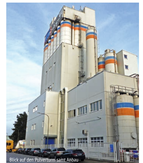
Blick auf den Pulverturm samt Anbau

Hier wurden u. a. zwölf große Rohstoffsilos und acht Kleinkomponentensilos angebunden. Daraufhin erfolgte der Einbau eines neuen 3.000-Liter-Mischers inklusive Vor- und Nachbehälter, bevor im letzten Schritt eine neue Abfüllanlage installiert wurde, durch die die Pulverprodukte in Ventilsäcke abgefüllt werden. Vom ersten Signaltest der Inbetriebnahme bis zur Produktion des ersten Produkts vergingen gerade einmal vier Wochen.