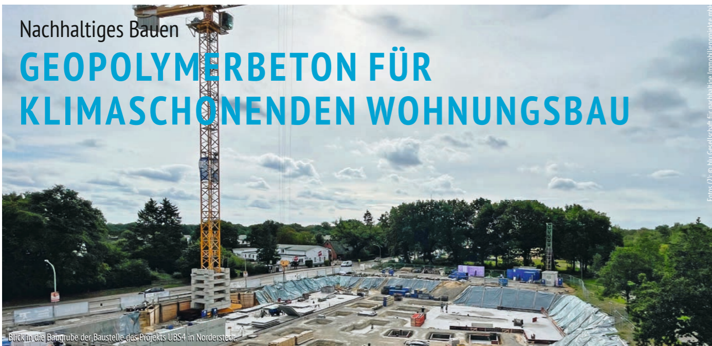
Blick in die Baugrube der Baustelle des Projekts UBS4 in Norderstedt.