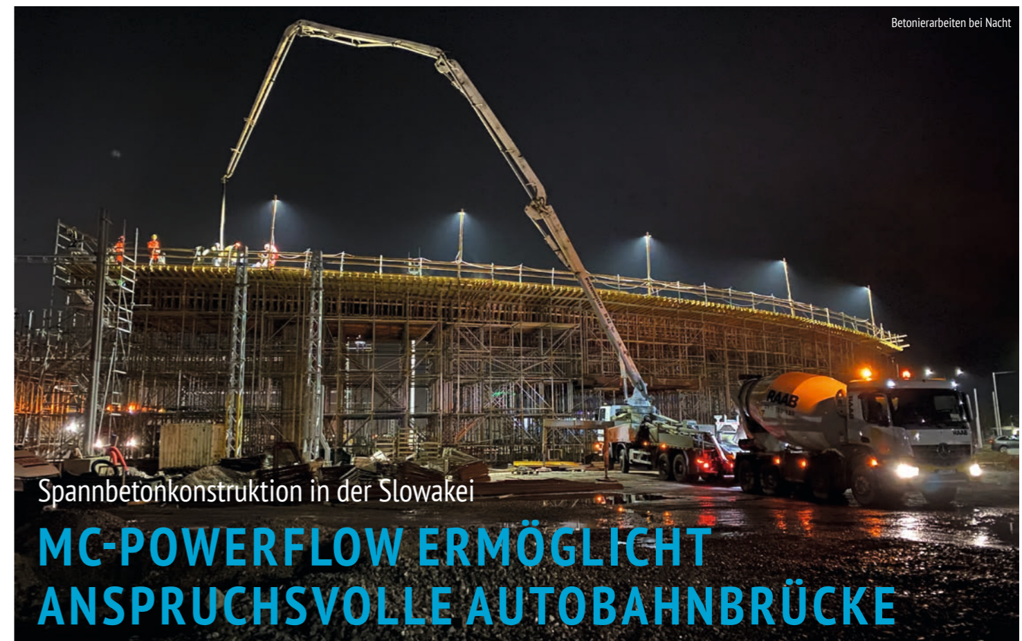
Betonierarbeiten bei Nacht