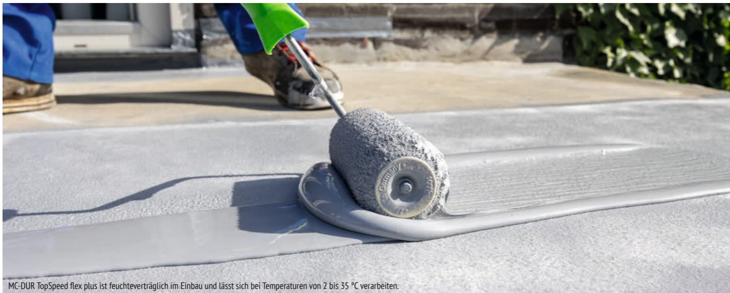
MC-DUR TopSpeed flex plus ist feuchteverträglich im Einbau und lässt sich bei Temperaturen von 2 bis 35 °C verarbeiten.