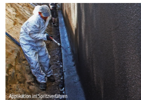
Applikation im Spritzverfahren