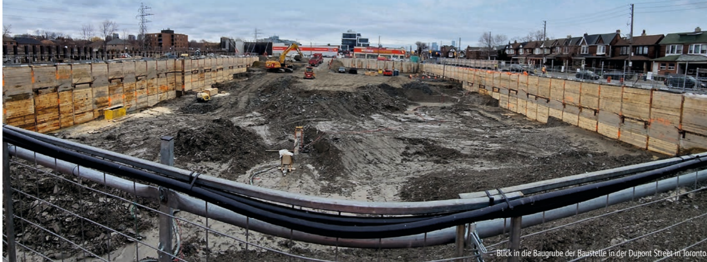
Blick in die Baugrube der Baustelle in der Dupont Street in Toronto.

Bei einem Neubauprojekt in Toronto war im April 2023 das Injektions-Know-how der MC gefragt. Ziel war es, die in einem Teilbereich unzureichende Sicherung der Baugrube eines zu errichtenden Büro- und Wohngebäudes zu unterstützen und den dahinterliegenden instabilen Boden zu stabilisieren, damit die Bauarbeiten planmäßig fortgesetzt werden konnten. In gerade einmal zwei Wochen konnte der Baugrund mit MC-Injekt GL-95 minimalinvasiv, zeitsparend und effizient stabilisiert werden, sodass die Aushubarbeiten auch in diesem Bereich fortgesetzt werden konnten.