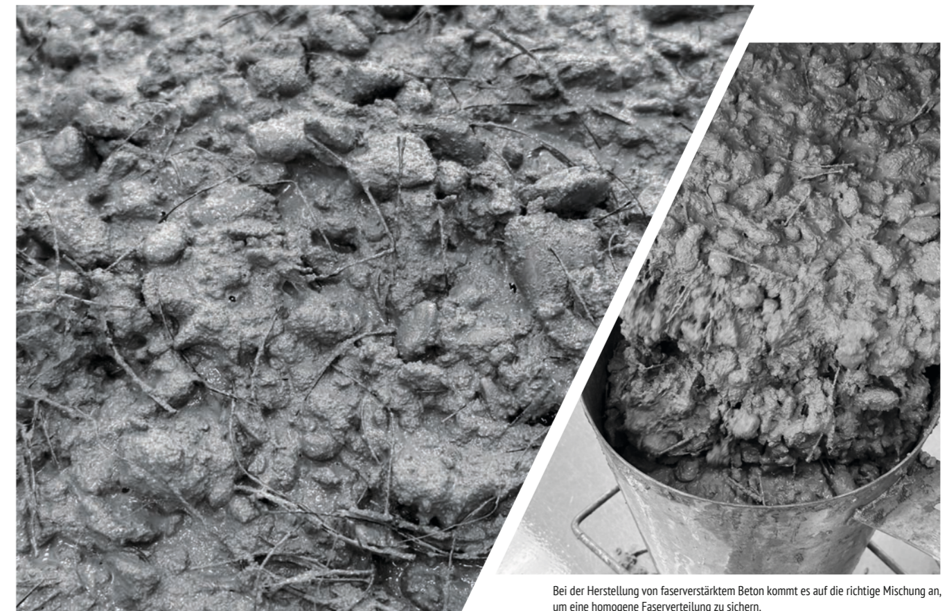
Bei der Herstellung von faserverstärktem Beton kommt es auf die richtige Mischung an, um eine homogene Faserverteilung zu sichern.