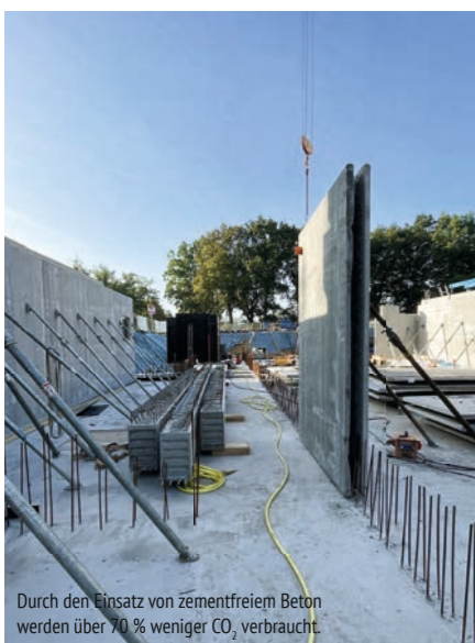
Durch den Einsatz von zementfreiem Beton werden über 70 % weniger CO 2 verbraucht.