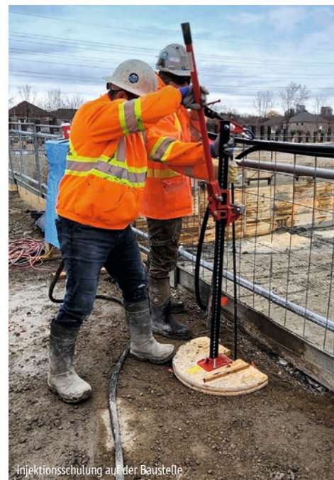
Injektionsschulung auf der Baustelle