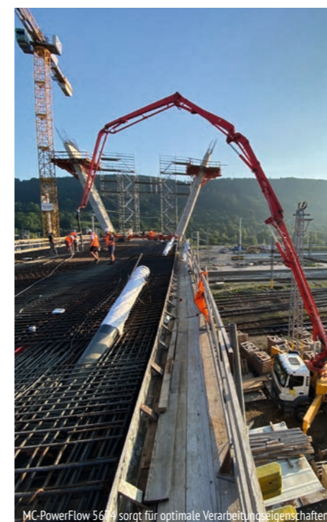
MC-PowerFlow 5674 sorgt für optimale Verarbeitungseigenschaften.

Die slowakische Industriestadt Žilina mit rund 81.000 Einwohnern liegt 200 km nordwestlich der Hauptstadt Bratislava. Hier startete 2021 das bislang größte Infrastrukturprojekt der staatlichen Eisenbahngesellschaft (ŽSR), an dessen Ende der komplexe Umbau des wichtigen Eisenbahnknotens Žilina steht. Das Projekt wurde in unabhängig voneinander realisierbare Einheiten unterteilt, um eine optimale Organisation des Bauablaufs bei gleichzeitiger Aufrechterhaltung des Bahnbetriebs zu ermöglichen.