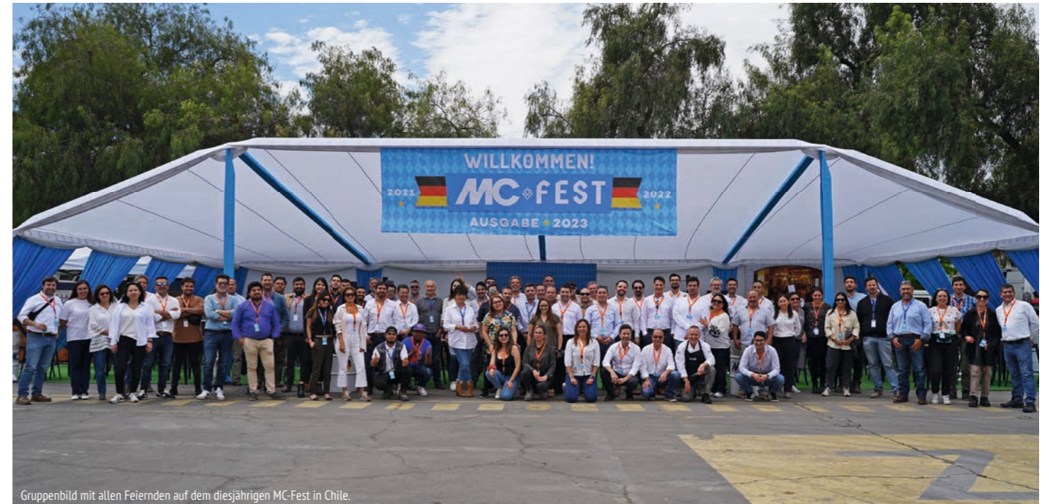
Gruppenbild mit allen Feiernden auf dem diesjährigen MC-Fest in Chile.

Am 9. November 2023 fand an unserem Hauptsitz in Chile das dritte MC-Fest statt, an dem mehr als 80 Kunden aus den Bereichen Infrastruktur & Industrie, Hochbau und Betonindustrie teilnahmen.