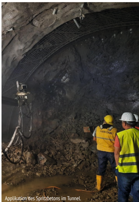
Applikation des Spritzbetons im Tunnel.